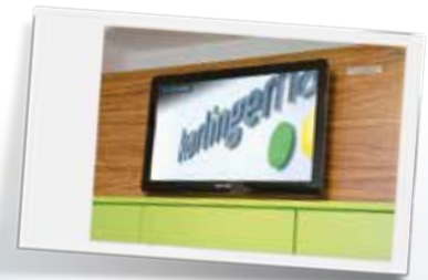
Zimmer mit TV