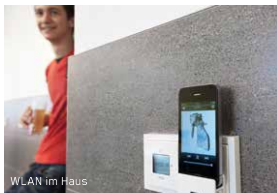
WLAN im Haus

DAS KARLINGERHAUS PRÄSENTIERT SICH ÄUSSERST VIELSEITIG: VON PÄDAGOGIK, ERLEBNIS, SPORT, FREIZEIT BIS HIN ZUM SEMINAR, WIRD GANZJÄHRIG EIN SEHR BREITES SPEKTRUM GEBOTEN.